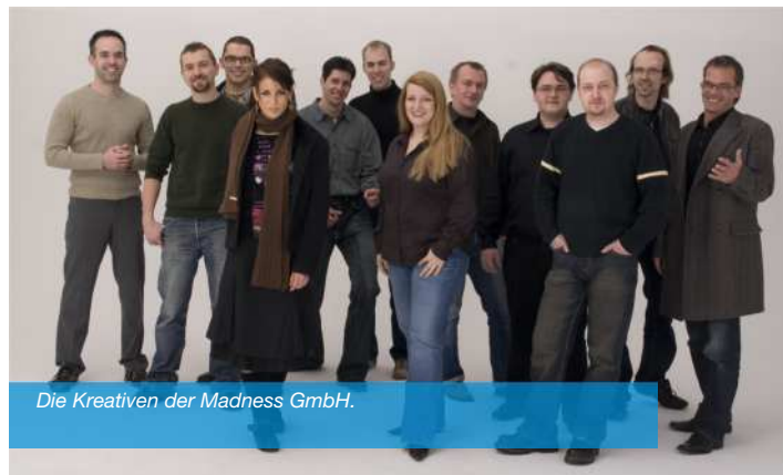
Die Kreativen der Madness GmbH.

Ein Start-up wird erwachsen – und startet voll durch. Schon vor sechs Jahren wurde die Göppinger Madness GmbH gegründet. Doch 2006 begann eine neue Zeitrechnung: Nach einem Gesellschafterausstieg positionierte sich das Unternehmen neu.