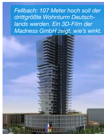
Fellbach: 107 Meter hoch soll der drittgrößte Wohnturm Deutschlands werden. Ein 3D-Film der Madness GmbH zeigt, wie's wirkt.

man Anreize bieten. Aber auch ganz grundlegende, strategische Fragen wurden angegangen, etwa wie Entscheidungen zügig getroffen und umgesetzt werden. „Manches lief vorher ziemlich durcheinander, aber jetzt sind wir richtig professionell aufgestellt.