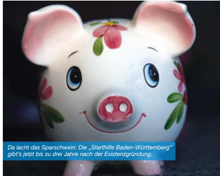
Da lacht das Sparschwein: Die „Starthilfe Baden-Württemberg“ gibt's jetzt bis zu drei Jahre nach der Existenzgründung.