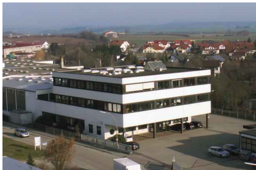
Der Sitz der araKON GmbH: Gewerbepark-A7 in Westhausen.

RKW Baden-Württemberg Rationalisierungs- und Innovationszentrum der Deutschen Wirtschaft Königstraße 49 70137 Stuttgart